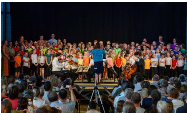
Première partie du concert du Quatuor MODIGLIANI à Saint-Jans-Cappel (59)