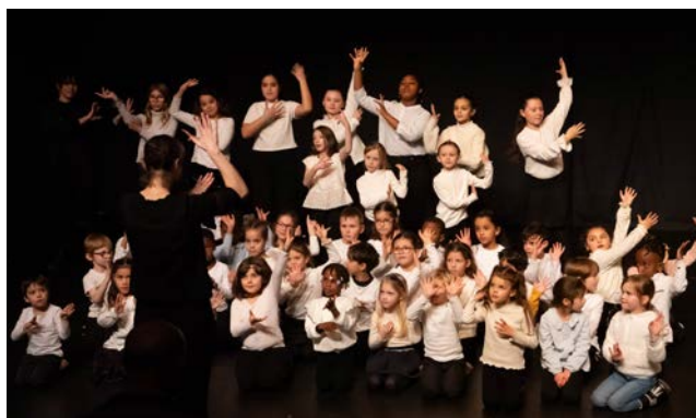
Atelier « Musique en Mouvement » à Wattignies (59)