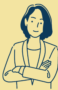
ASSISTANTS DE VIE