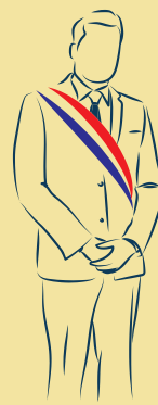
ÉLUS ET ACTEURS LOCAUX